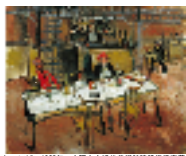
871-5433 1929年 大阪市立近代美術館蔵 佐伯祐三画

会場 大阪市立美術館 会期 2008年9月9日(火)～10月19日(日) 休館日 9月16日・22日・29日・10月6日・14日 開館時間 9:30～17:00(最終入場は16:30) 問合せ TEL:06-6771-4874 http://osaka-art.info-museum.net/